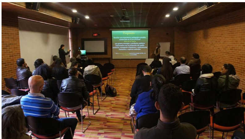
Socialización de experiencia en el Tercer Encuentro, 2016