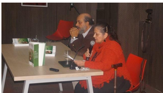
Lanzamiento del libro 13 de diciembre de 2016

El lanzamiento se realizó en las instalaciones de Aduanilla de Paiba y contó con gran afluente de autores reunidos para reflexionar sobre los avances logrados después del encuentro y lo que esto significa en el campo de las experiencias alternativas en la educación superior, para construir diálogos académicos pertinentes para la práctica docente en la Universidad Distrital Francisco José de Caldas.