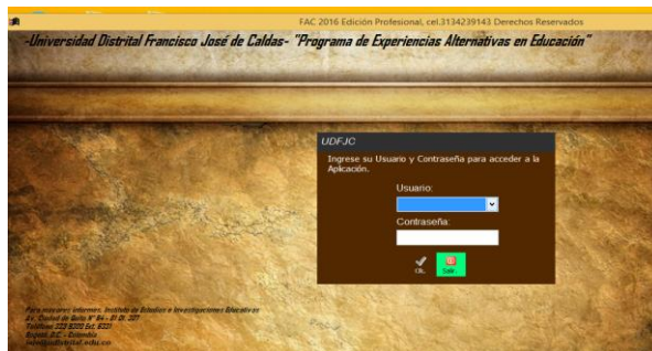
Plataforma Educación de Experiencias Educativas

presentadas durante los últimos tres encuentros de experiencias realizados por el IEIE