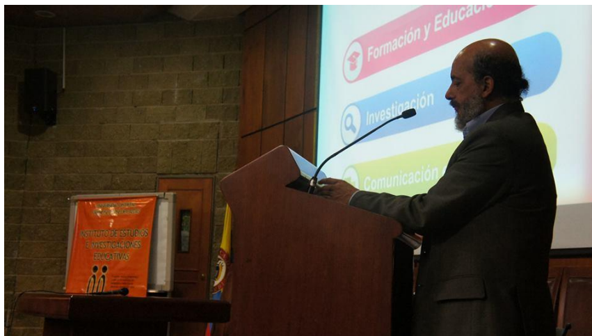
Socialización de convocatorias IEIE2016