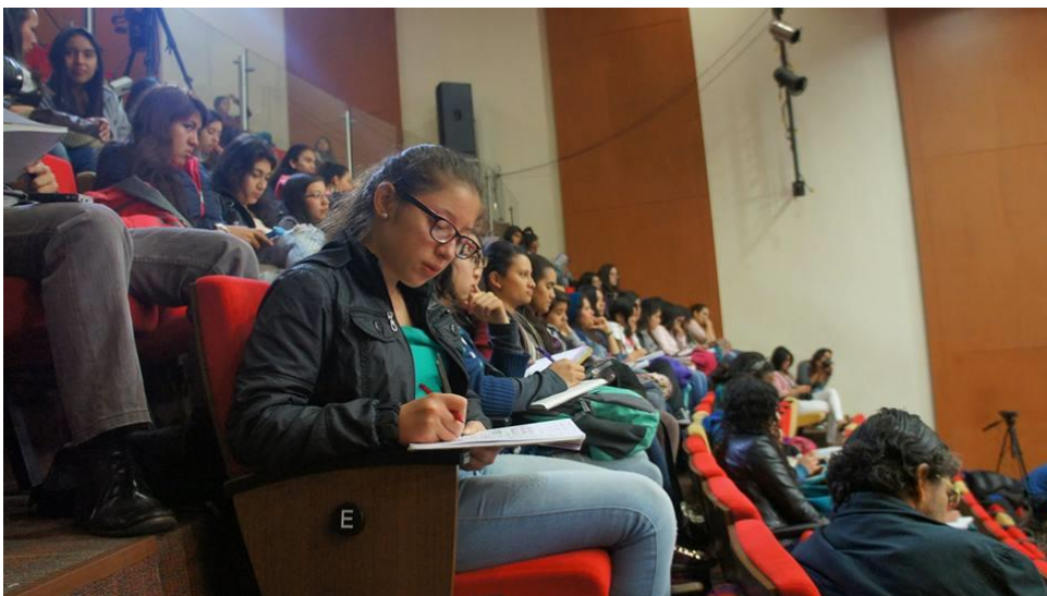
Encuentro de Experiencias Alternativas en Educación Inicial