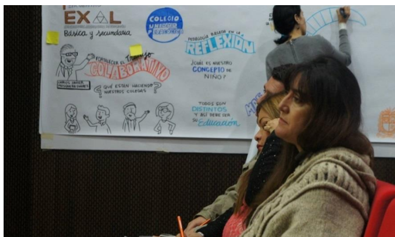
Socialización experiencia colegios públicos en Bogotá