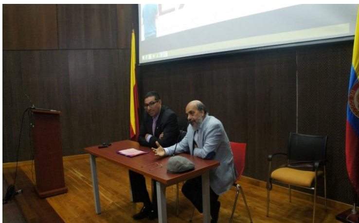
Palabras de instalación del evento