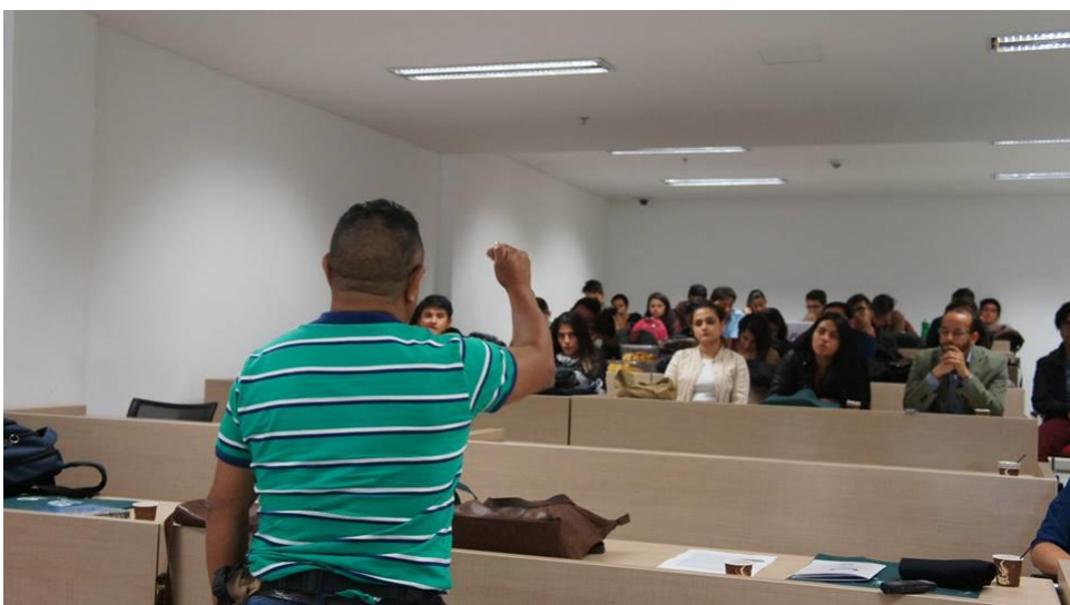
Encuentro de Experiencias Alternativas en Educación Superior